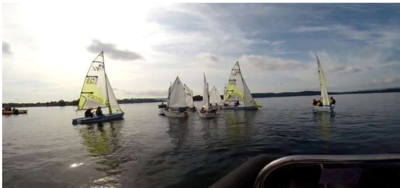
Bilde fra Bærum Seilforenings Sommerleir