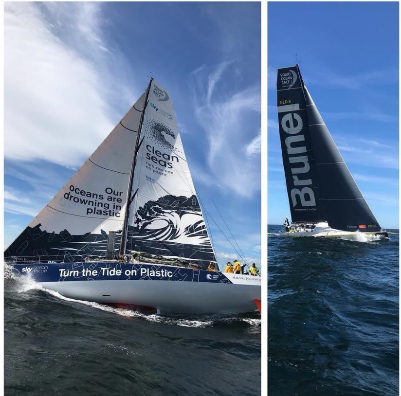
NC-gruppen fikk tatt en nærmere kikk på Volvo Ocean Race-båtene under treningssamling i Arendal i juni.

I løpet av sesongen har Bærum Seilforening markert seg som en ledende klubb i optimistjolle. Under lagcupen i Bergen stilte Bærum med til sammen 6 seilere fordelt på 3 lag, men dessverre ikke med resultater så høyt som ønsket.