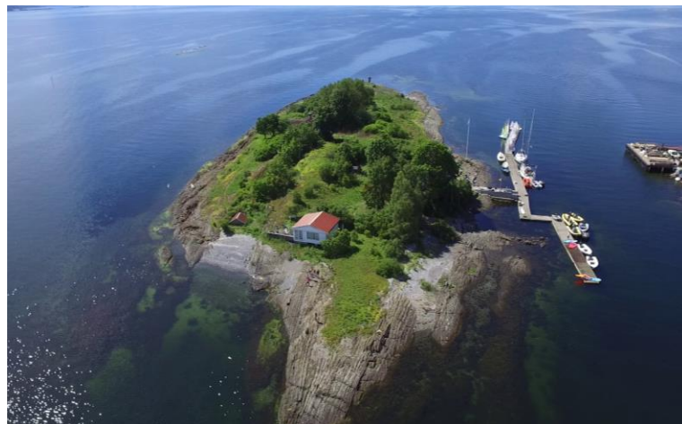
Klubbhuset på Ytre Vassholmen fikk nytt møne i 2018. Arbeidet ble utført på dugnad.

I Bruksveien er det stort sett seileraktivitet på onsdager, samt at det har vært en god del utleie i helgene. Begge husene brukes jevnt og trutt til ulike møter på kveldstid av foreningens ulike grupper.