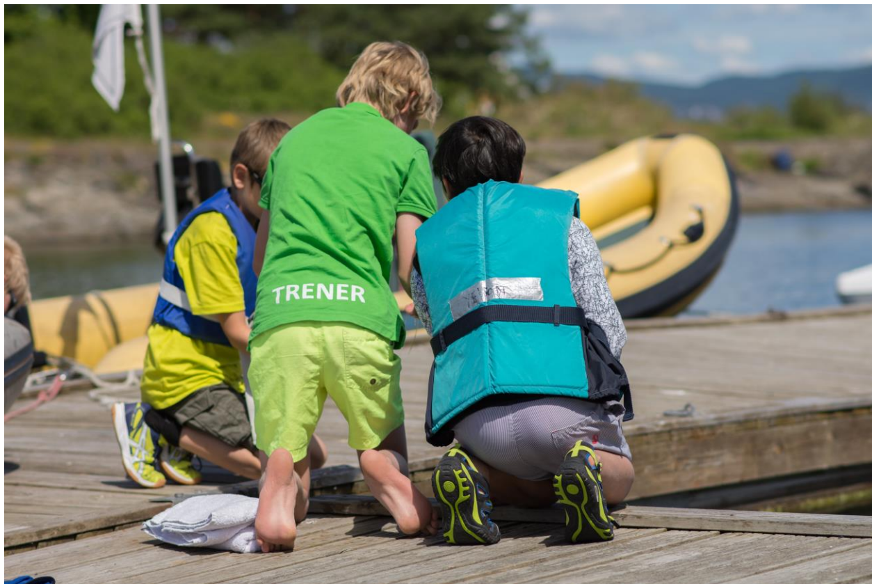
Krabbefiske på Ytre Vassholmen. Bildet er fra 2017.

Arbeidsgruppen består av 10 trenere, og har i skrivende stund møttes syv ganger jevnlig utover høsten/vinteren for å planlegge leiren. Hovedoppgavene har vært å utarbeide ulike budsjetter som investeringsbudsjett, driftsbudsjett, aktiviteter, dagsplaner, ukeplaner, samt avklare ulike reguleringer og lovbestemmelser.