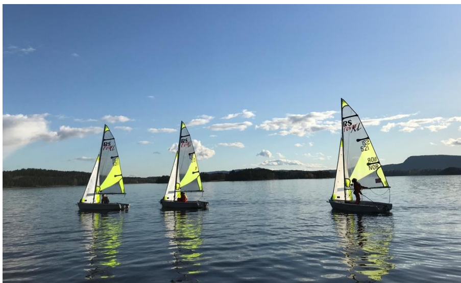
Fra trening på Sarbuvollen.